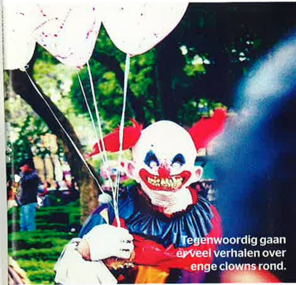
Tegenwoordig gaan er veel verhalen over enge clowns rond.