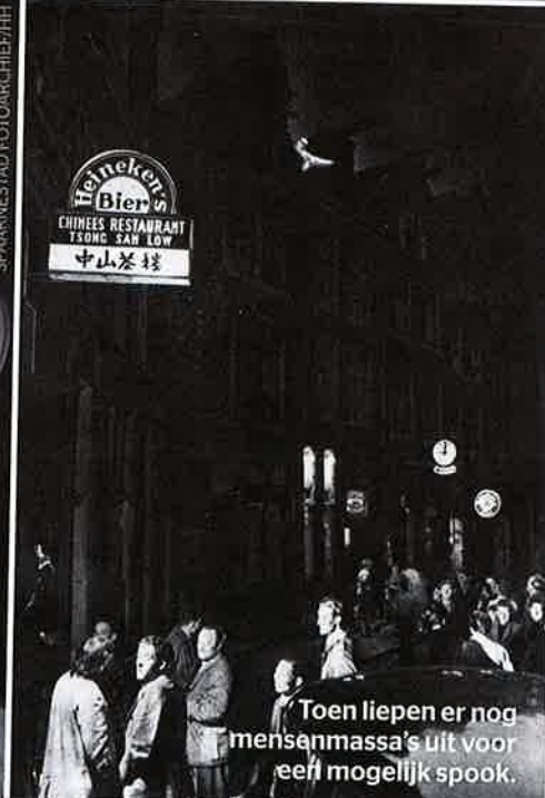
Toen liepen er nog mensenmassa's uit voor een mogelijk spook.