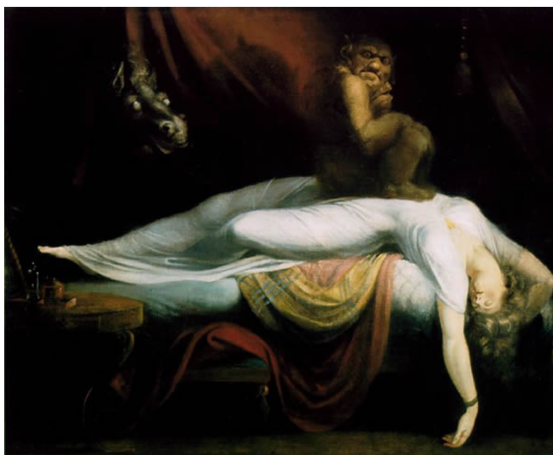
Romantische voorstelling van de nachtmerrie (Henri Fuseli, 1782)

Het is een intrigerend verhaal, omdat het geen sage is die over anderen handelt, maar het relaas is van wat de verteller zelf heeft meegemaakt. Is het waar of niet waar, inbeelding, bijgeloof of echt gebeurd? Men zou geneigd zijn om het op een zinsbegoocheling te gooien, maar in werkelijkheid is voor dit fenomeen een medische verklaring gevonden.